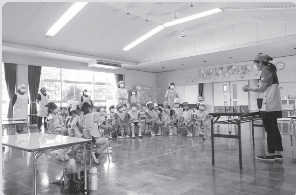
▲「しっかり聞いてね！」出前講座の様子

出前講座では、健康推進員さんのお話だけでなく、参加されている地域の人に普段から行っている健康づくりの取組を紹介していただき、健康づくりを少しでも身近に感じてもらえるようにしています。