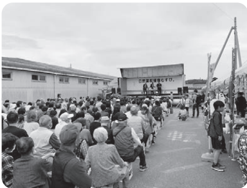
▲昨年の連携イベントの様子

近江鉄道線が100円（小学生以下は無料）で1日乗り放題となる「ガチャフェス」の日に合わせて、むすび祭りを開催。