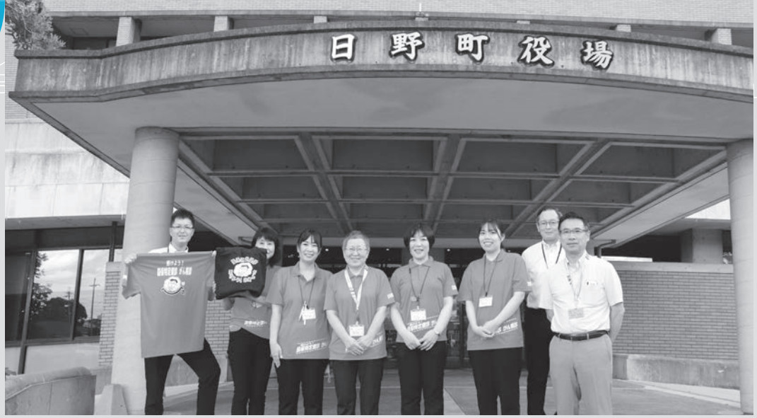
▲福祉保健課、住民課の皆さん