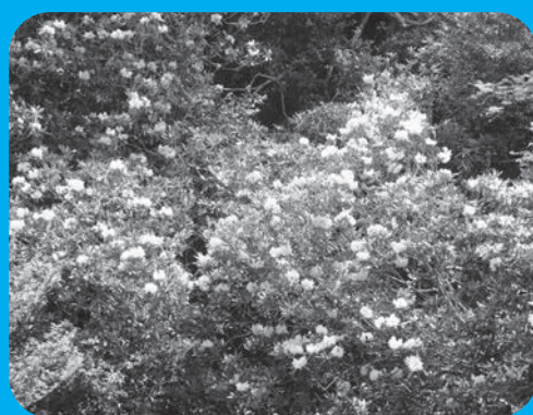
鎌掛谷ほんしゃくなげ群落

地区組織と連携した健康づくり事業と子どものころからの健康教育で親子ともに健康啓発！