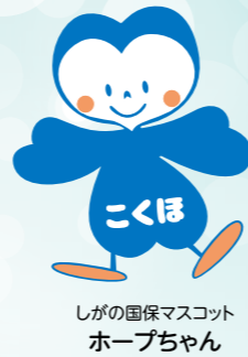
しがの国保マスコット ホープちゃん

つきましては、その方の国保の加入手続きを円滑に行うため、下記のような「退職証明書」を交付いただき、併せて退職時の健康保険等の内容をお知らせいただきますよう、ご協力お願い申し上げます。