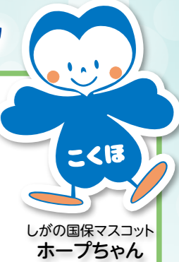
しがの国保マスコット ホープちゃん

国民健康保険(国保)とは、いつどんなときにかかるかわからない病気やけがの医療費の負担を少しでも軽くするため、日ごろ健康なときから加入者みんなで保険料(税)を出し合い、必要な医療費や加入者の健康づくりに役立てるものです。