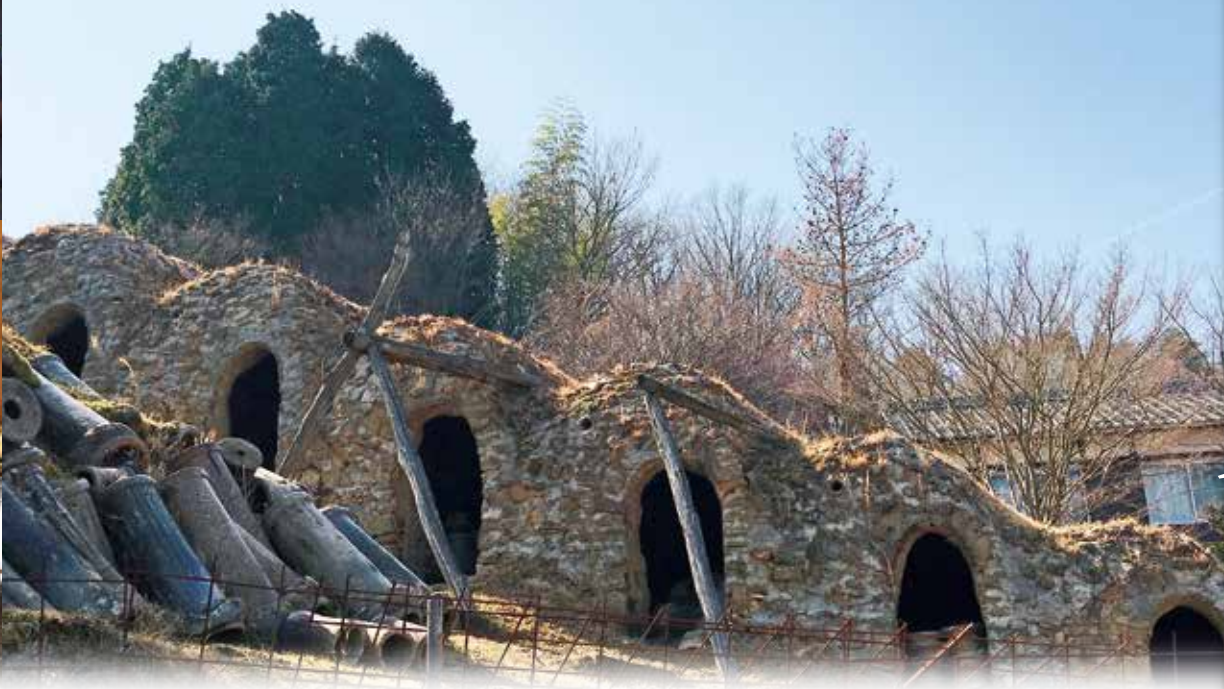
滋賀県史跡丸又窯