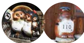
散策路で見つけた信楽焼