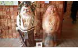
信楽伝統産業会館にて