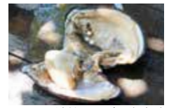
池蝶貝とびわ湖真珠

化したり、魚の産 卵や鳥の巣作りの 場所にもなってお り、最近では「守る・ 育てる・活用する」 活動も行われていま す。また、西の湖では独特の色 と輝きを放つ「びわ湖真珠」が養 殖されています。母貝は琵琶湖 の固有種・池蝶貝(いけちようが い)。この貝も水を浄化する作用 があり、長い時間をかけて美し い真珠を育てながら、水環境も 守っています。