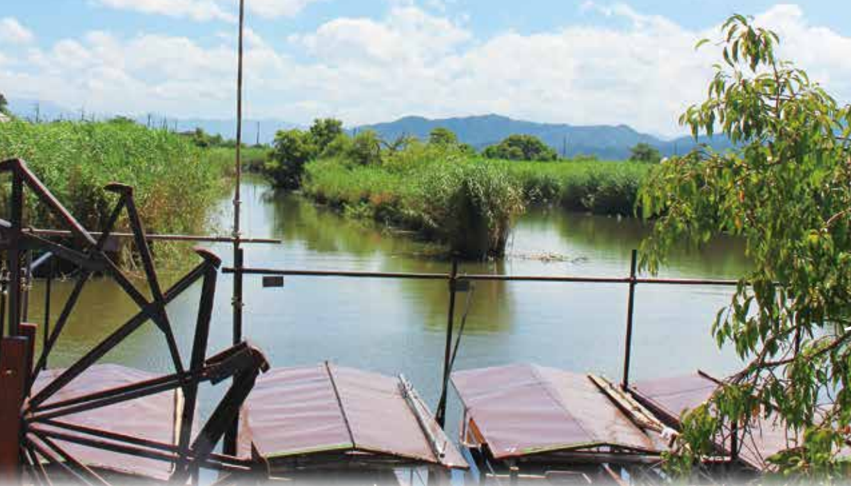
水郷のさとまるやま 船のりば

今回は琵琶湖を歩くをテーマに手漕ぎ船に乗って西の湖周辺を巡る体験をしていきます。